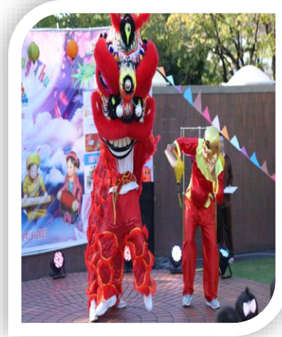
ベトナム中秋の名月 (R5.9.24)

日本に十五夜での風習があるように、ベトナムにも中秋の名月という伝統的な風習があります。ベトナム語で「 テトチュントウ 」と言います。旧暦の8月15日に毎年行われます。中秋節には、故人を追悼するために果物の盆が飾られ、この機会にメンバーが集まり、再会することがよくあります。また、中秋節はこどものための日とも言われます。全国から、こどもたちは一緒に昔話を聞いたり、遊んだり、獅子舞を見たり、提灯を持ってお祭りを終わらせたりします。